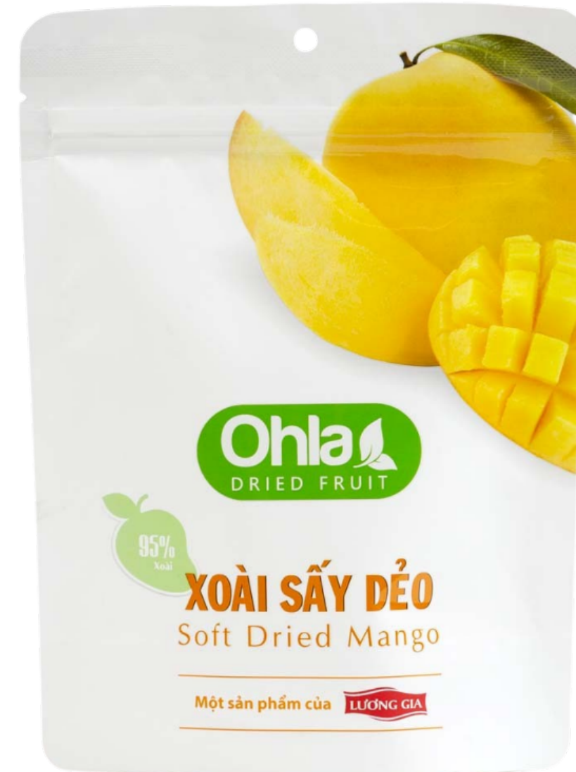
어드밴스 건망고 100g (Soft-Dried Mango)