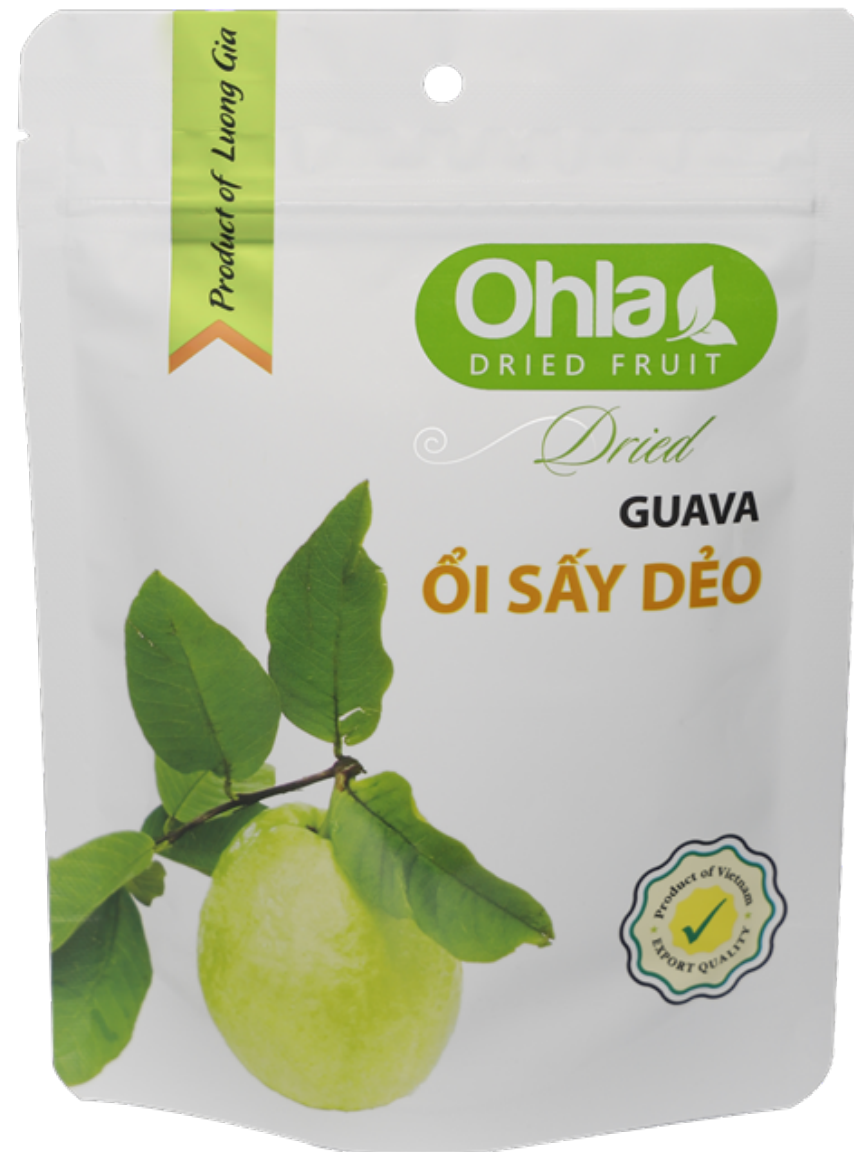
건 구아바 (Dried Guava)