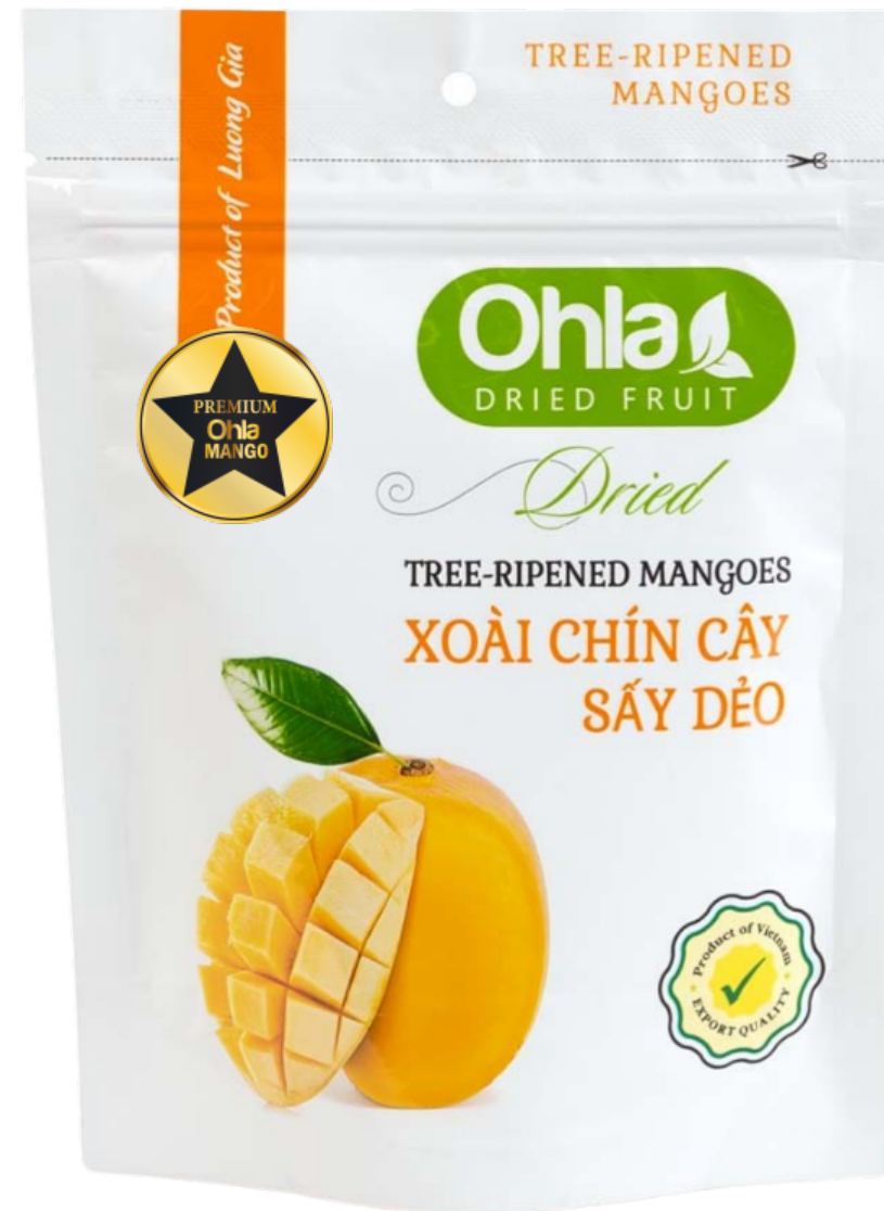
프리미엄 건망고 100g (Tree-Ripened Mango)