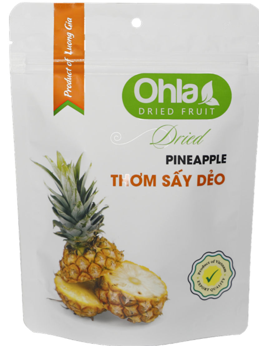
건 파인애플 (Dried Pineapple)