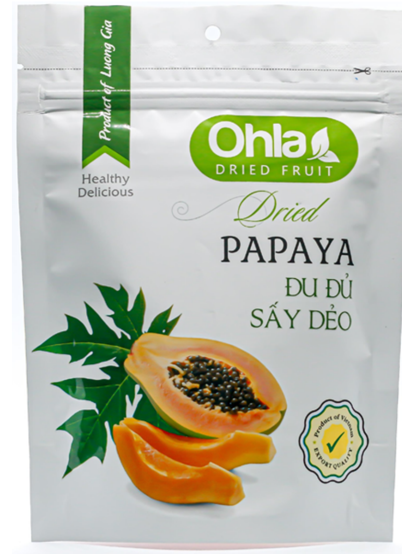
건 파파야 (Dried Papaya)