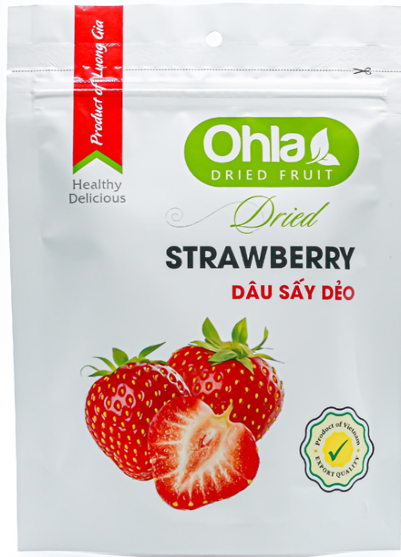
건 딸기 (Dried Strawberry)