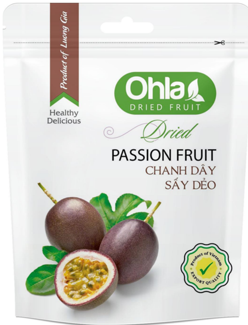
건 패션후르츠 (Dried Passion Fruit)