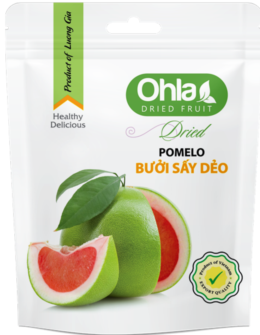
건 포멜로 (Dried Pomelo)