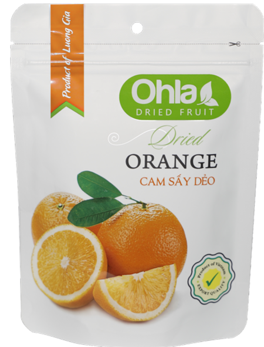
건 오렌지 (Dried Orange)