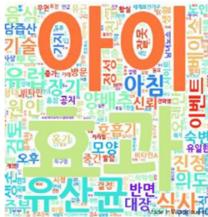
[건강식품 리뷰 키워드]