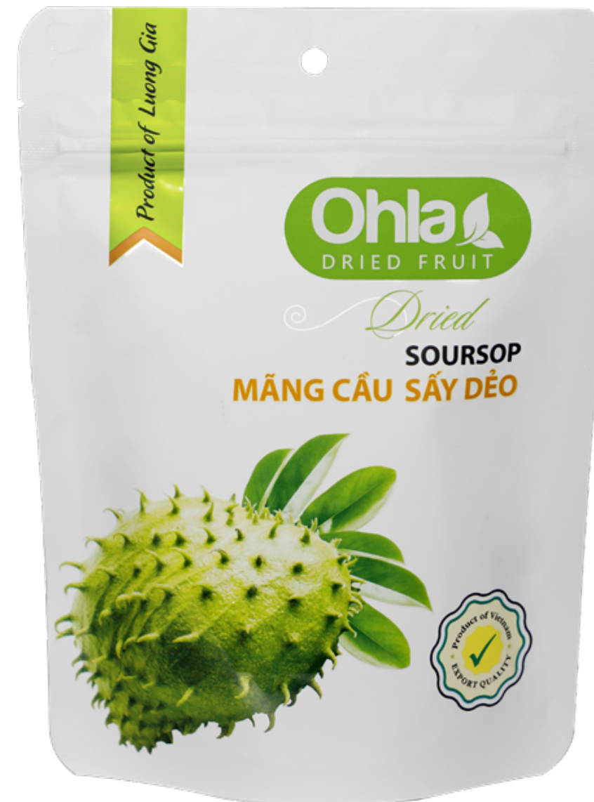
건 사워썹 (Dried Soursop)