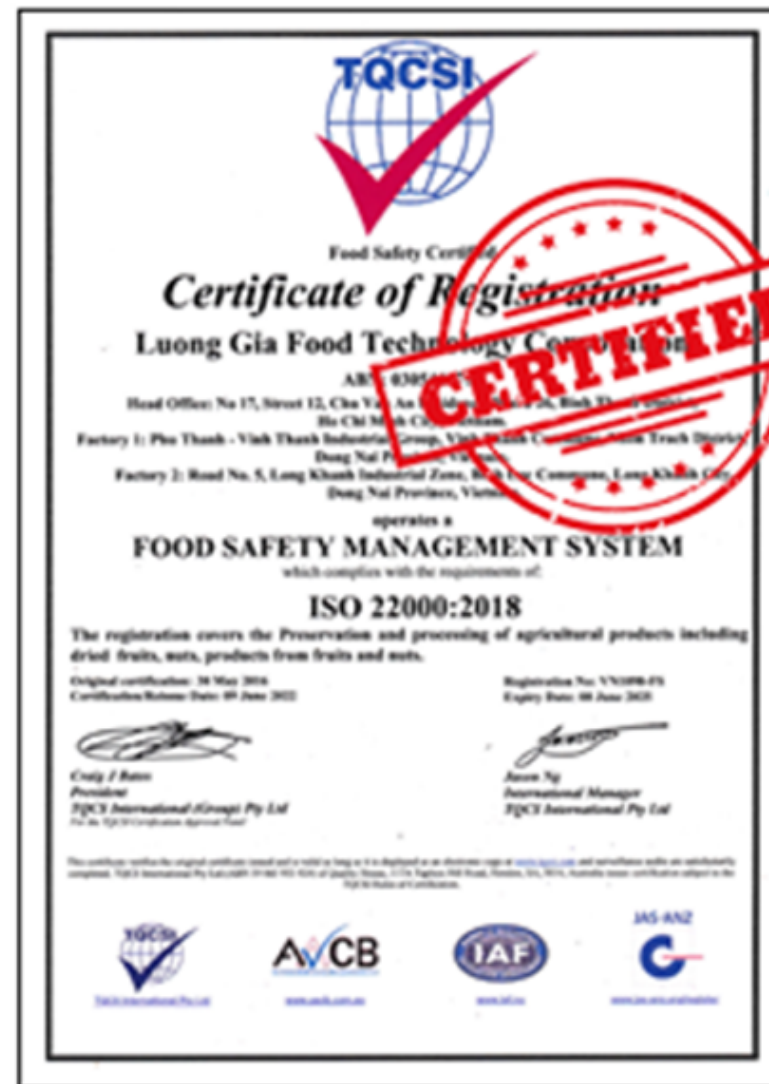
ISO 22000 인증