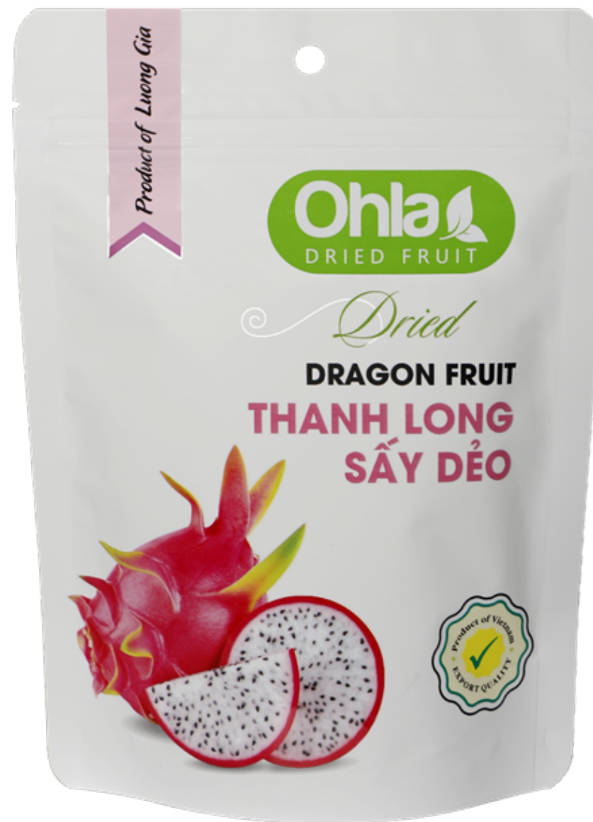
건 용과 (Dried Dragon Fruit)