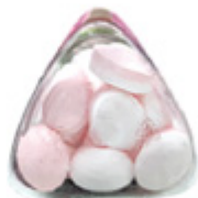
한손에 쏙 들어오는 심각형 통